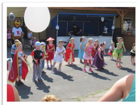
Pohádkový dětský den se opravdu zdařil