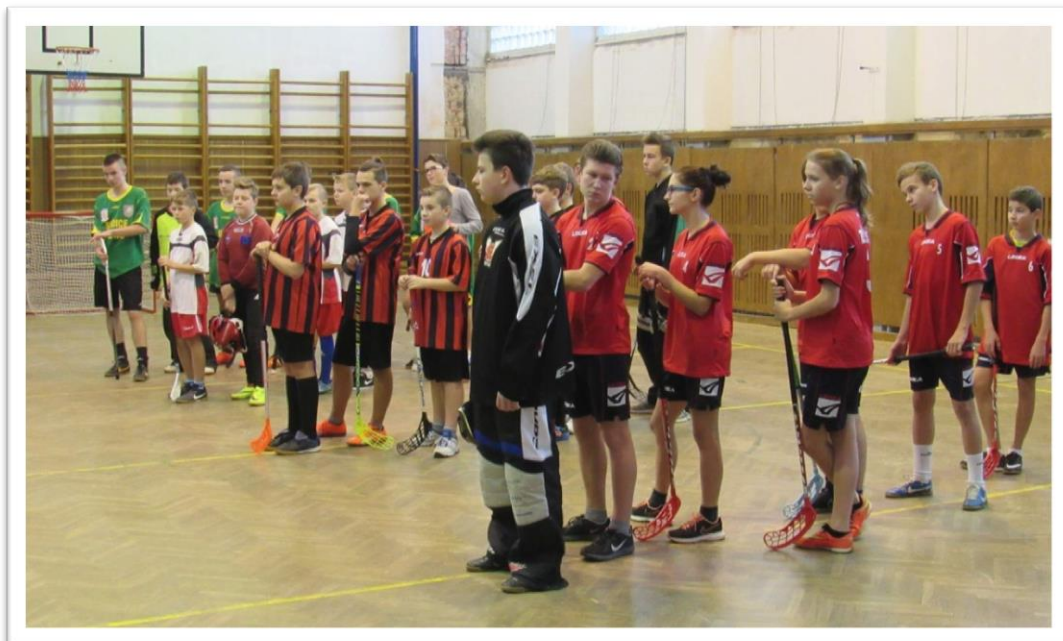
Mikulášský florbalový turnaj 4 škol v Sudicích