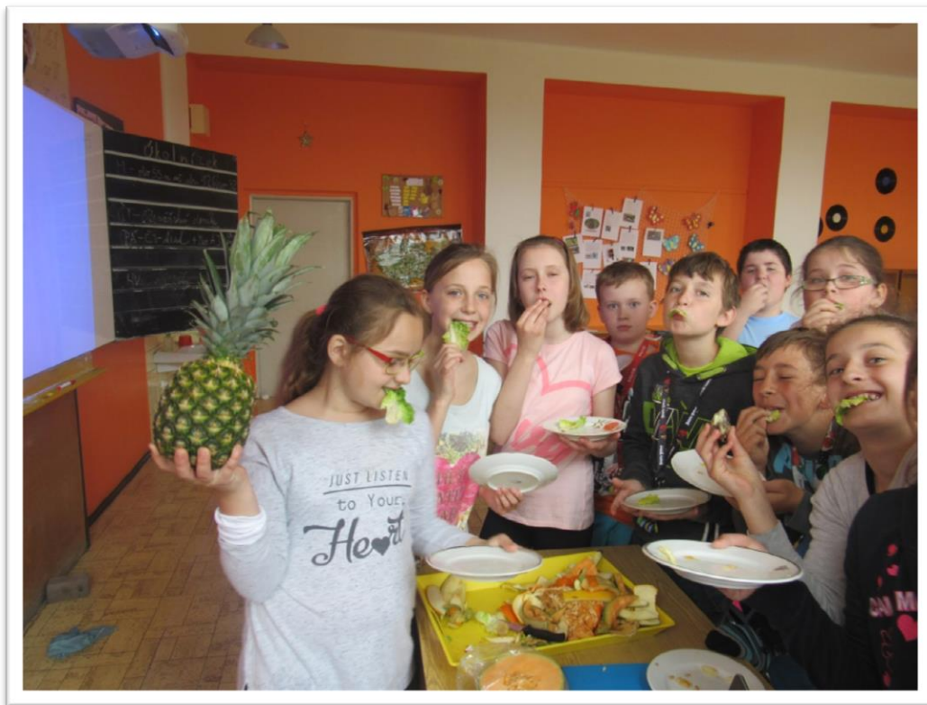
Projekt Ovoce do škol