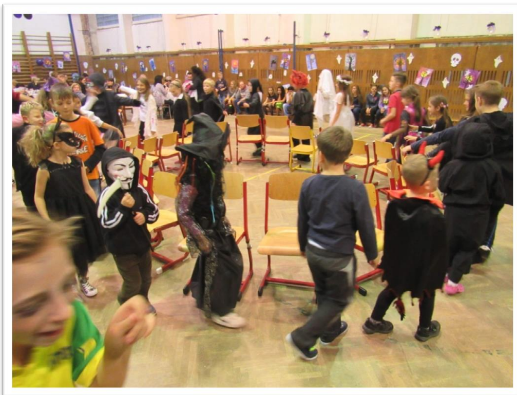
Halloweenský maškarní ples v režii žáků 8. a 9. tříd