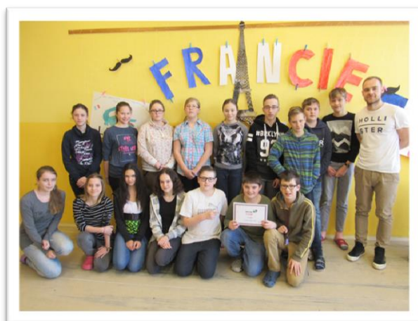
Vítězové soutěže o nejlépe vyzdobenou tříd