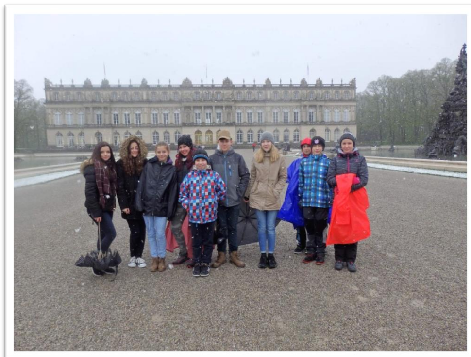
Zájezd do Německa „Po stopách Ludvíka II. Bavorského“