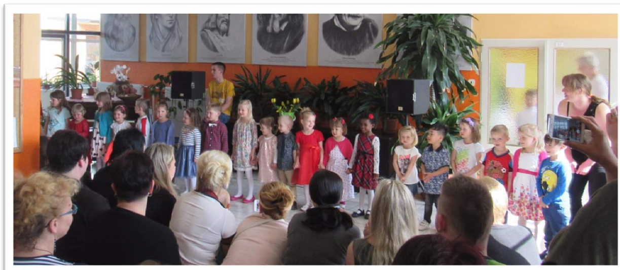
Z vystoupení MŠ pro maminky ke Dni matek