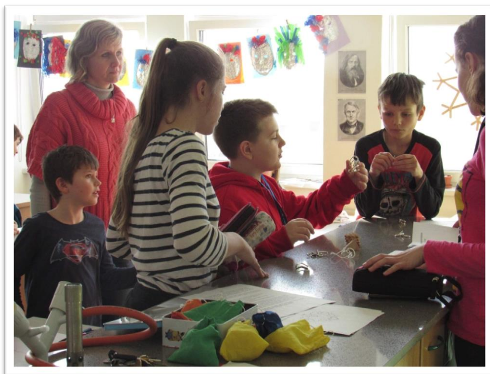
Valentýnské odpoledne s matematikou