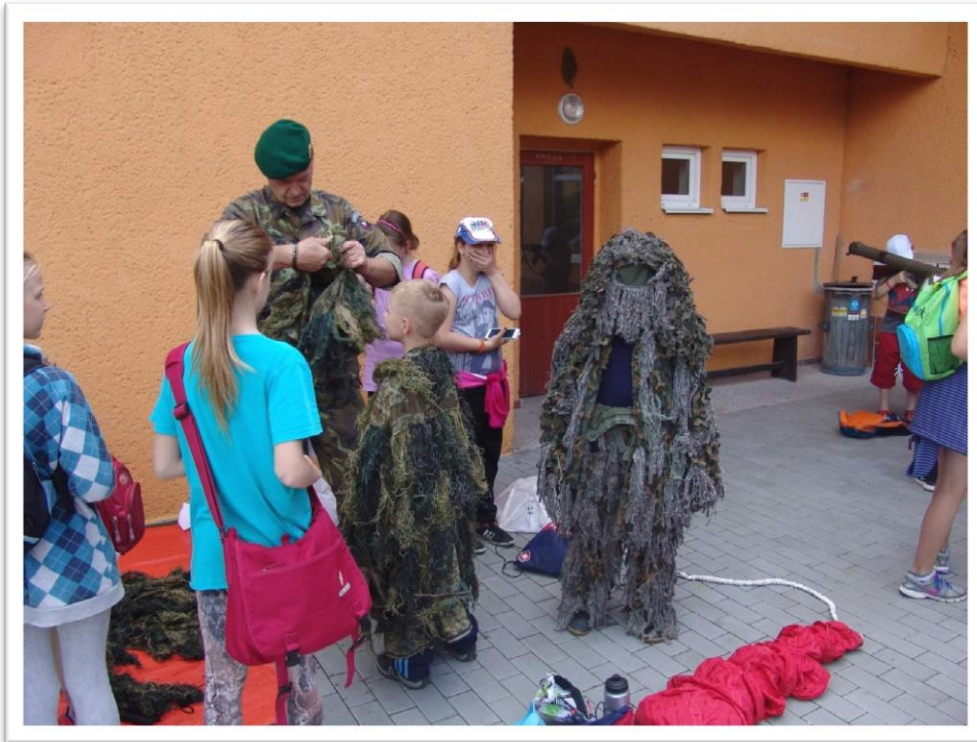
2. ročník Zborovského závodu branné zdatnosti