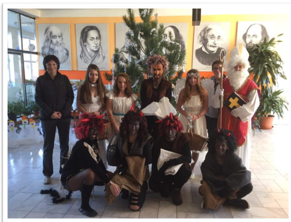
Žáci 9. třídy zorganizovali pro své spolužáky i děti v MŠ Mikulášskou nadílku.