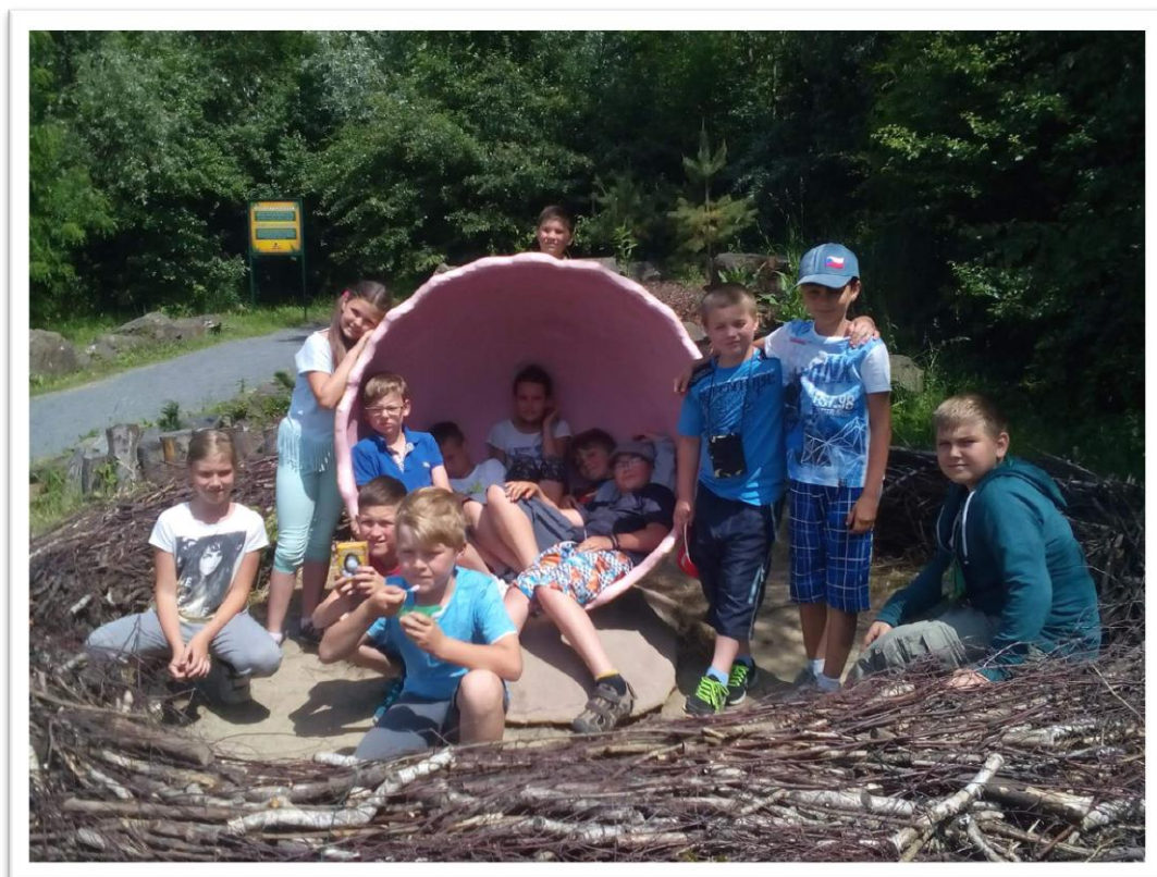
4. třída na výletě v Dinoparku Ostrava