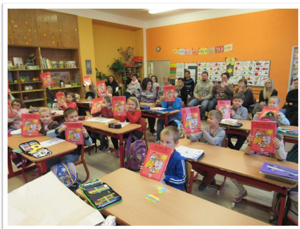
Slavnost slabikáře v 1. třídě