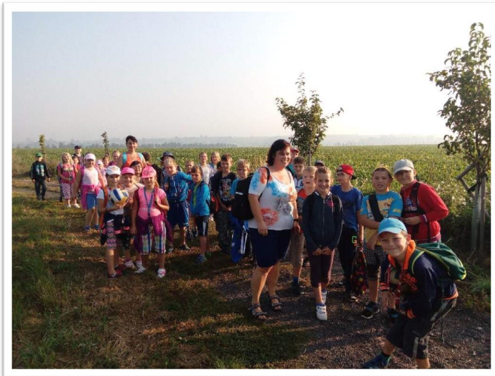
Den v přírodě