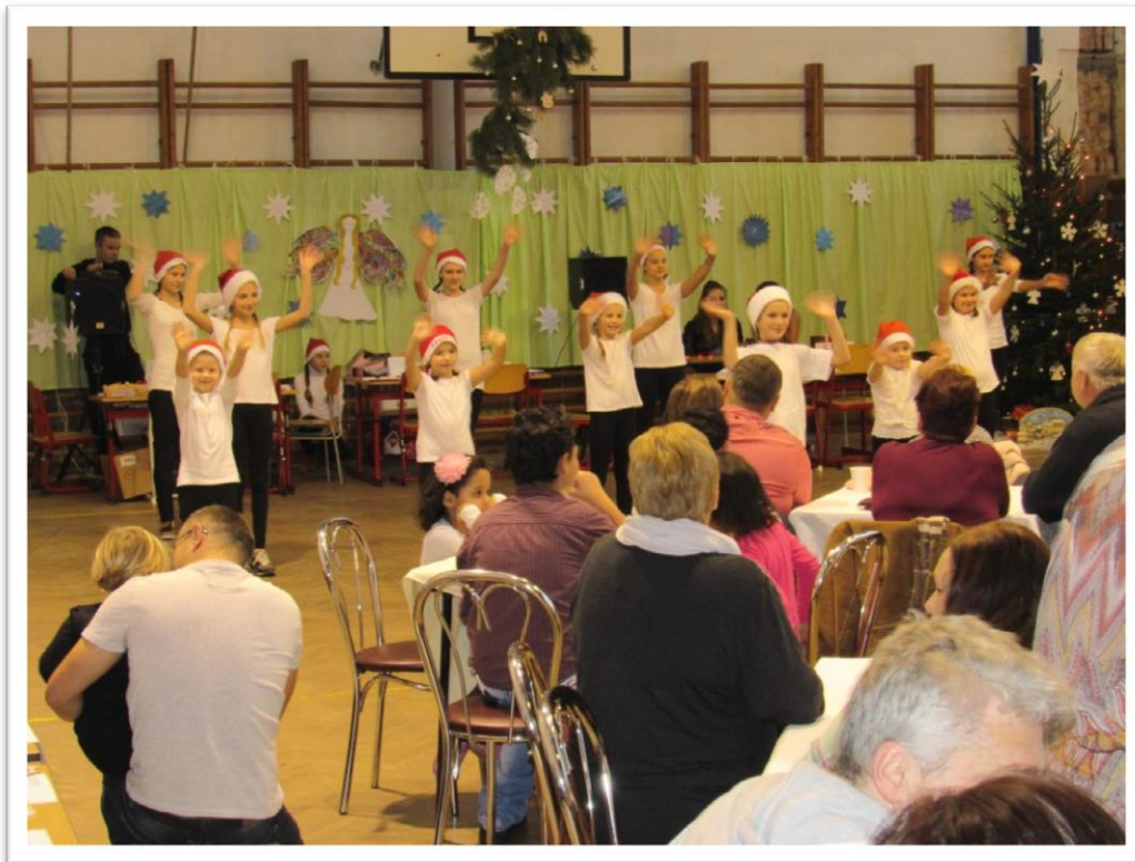
Vánoční jarmark 2016