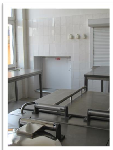
Prázdninové rekonstrukce v ZŠ a MŠ