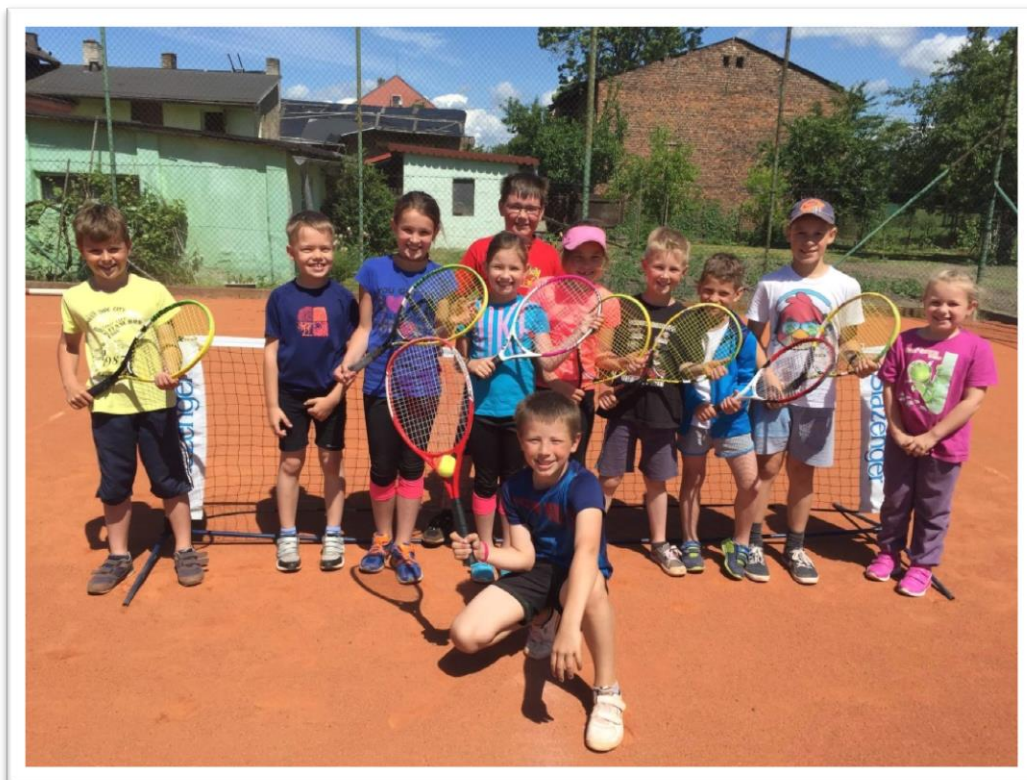
Turnaj v minitenisu