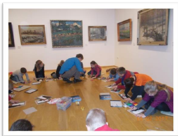
Žáci 1. stupně v galerijních dílnách v Ostravě