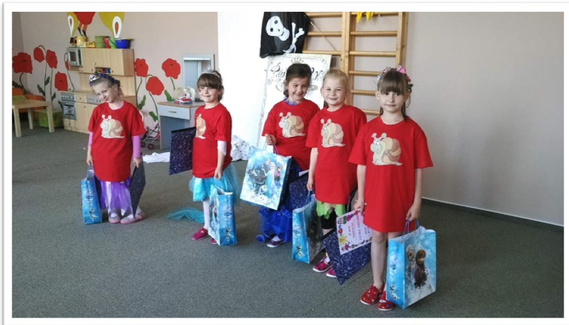
Pasování předškoláček v MŠ