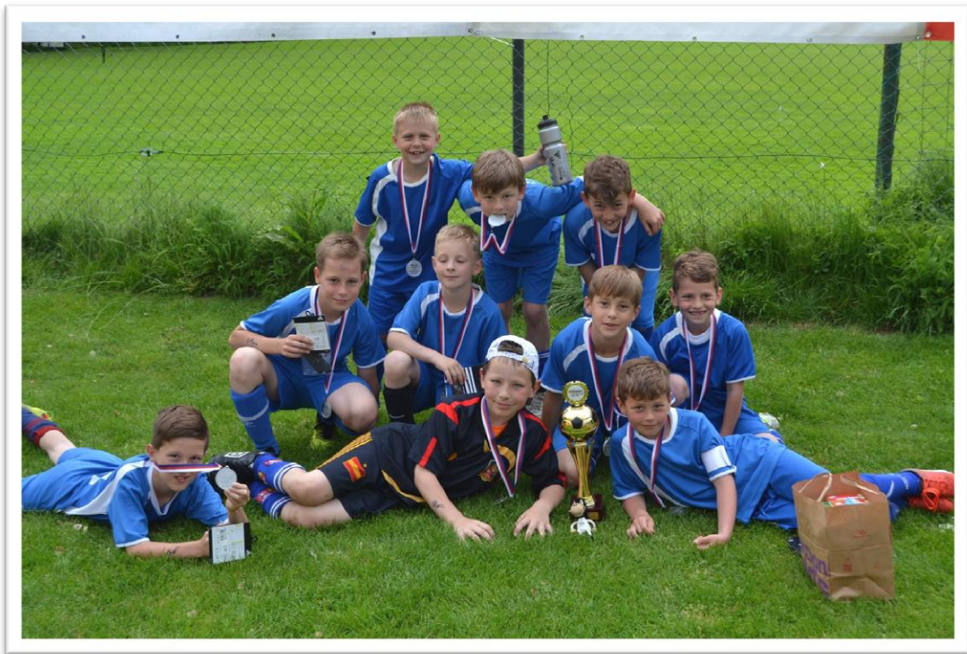
Krajské finále McDonalds Cup 1. kategorie – „stříbrné“ družstvo