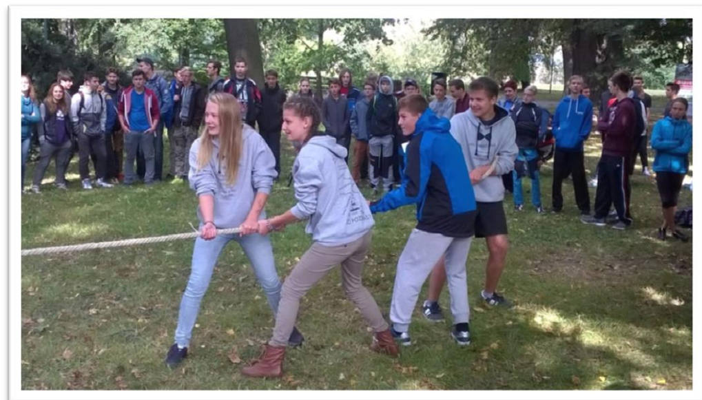
Soutěž škol „Najdi si svou kešku“