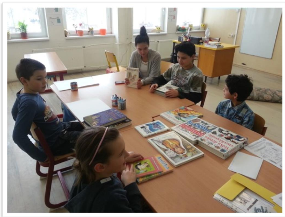
Čtenářský klub v rámci projektu OPVVV