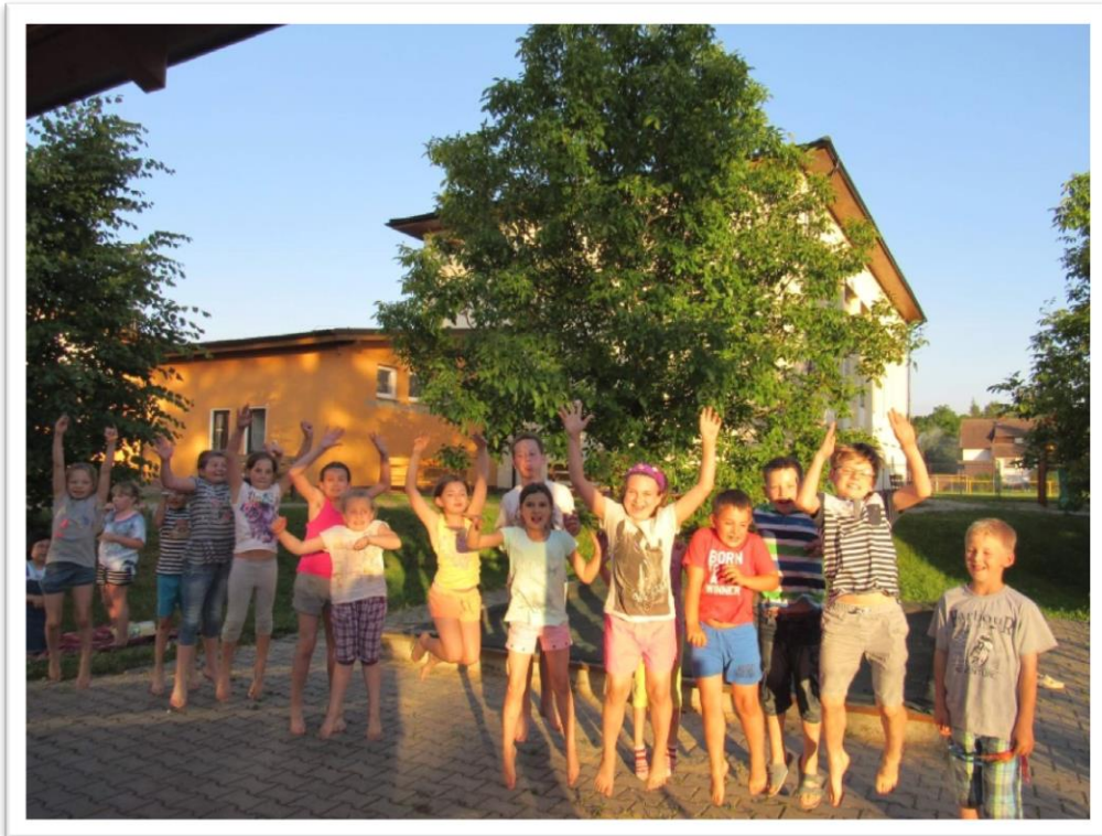
Noc v družině