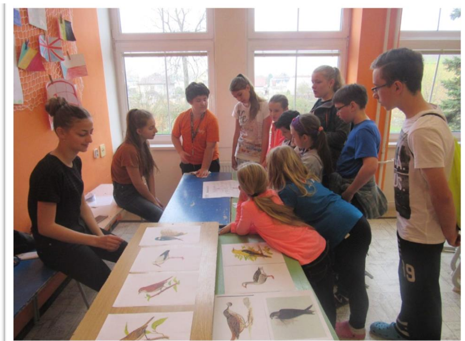
Projekt „Ptačí den“