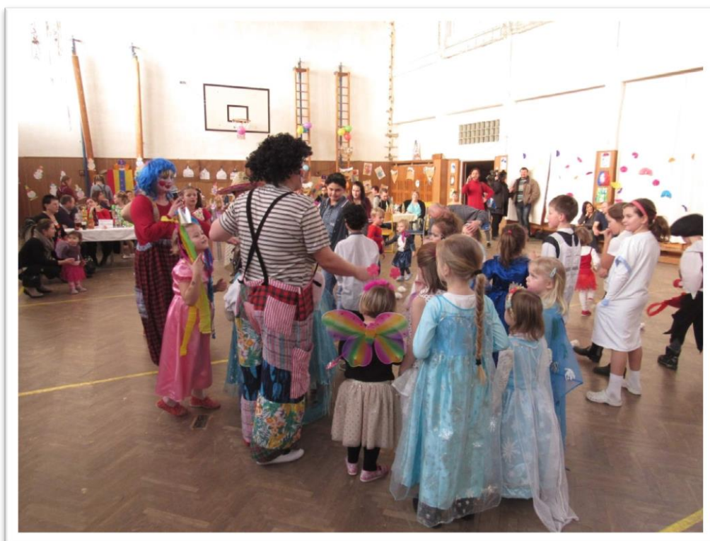
Tradiční oblíbená akce STROMu a ZŠ - dětský maškarní ples.