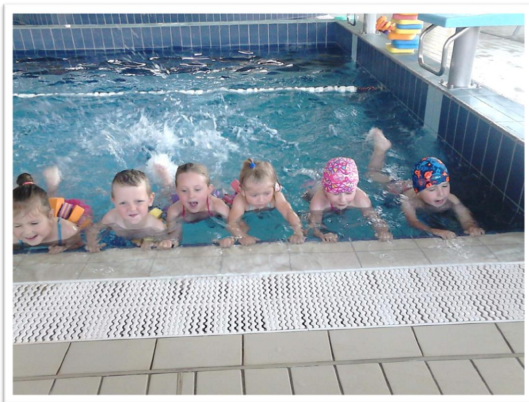
Děti z MŠ v plavecké školičce Hastrmánek v Kravařích